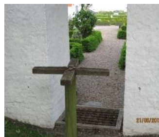
Færister ved Nr. Bork kirke

Mange steder var kirkegårdsdigerne sunket sammen, og hvis de ikke blev repareret, kunne løsgående kvæg, svin og får, ænder, gæs og høns let bryde ind på kirkegårdene.