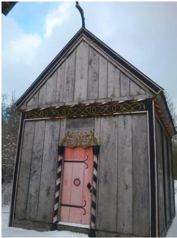
Rekonstruktion af trækirke fra 1000 tallet opført ved Moesgård museum, Århus

Under kirkerne var der som oftest en krypt , ( crypt = latin og betyder et skjult sted). Krypten var en kælder under kor-rum og apsis, hvor man begravede de døde, som i livet havde været betydningsfulde mennesker. I større kirker kunne man i katolsk tid have helgener begravet i krypten eller opbevare relikvier, dvs. ting, der havde tilhørt en helgen, eller små dele fra en helgens krop (knogler eller hår f.eks.).