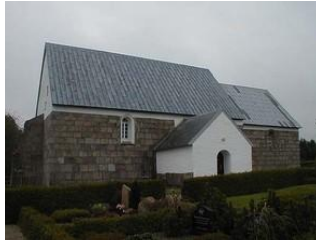
Hover kirke – et eksempel på en tidlig middelalder kirke i romansk grundform

En del kirker har stadig gravplader i kirkegulvet, der hvor fornemme mennesker engang er blevet begravet. I nogle kirker kan man stadig komme ned i krypten. Mange steder er de, der engang blev begravet under kirken, i dag blevet flyttet ud og begravet på kirkegården.