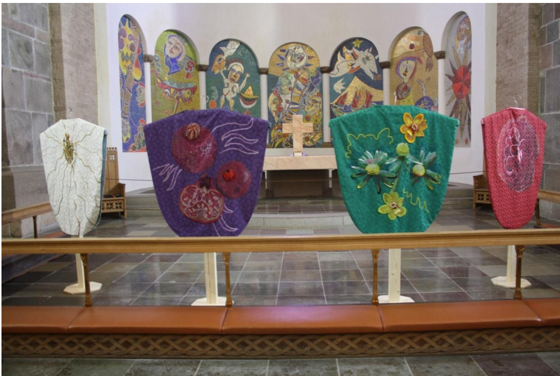
Messehageler i Ribe Domkirke lavet af Puk Lippmann

En messehagel er en slags kappe, som præsten tager på ovenpå præstekjole. Den bæres under altergangen og tages som regel af, efter at præsten har lyst velsignelsen. Det er ikke alle præster, der bruger messehagler. Det er heller ikke alle kirker, der har messehagler i alle de fire farver. Præsten tager messehagel på, mens menigheden synger den første salme efter prædikenen. Messehagelens farve skal passe til kirkeårets farve på den dag, man bruger den.