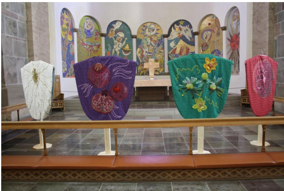
Messehageler fra Ribe Domkirke, syet af Dronning Margrethe d. II

En messehagel er en kappe præsten tager på over den almindelige præstekjole. Messehagelen viser den farve, der svarer til dagen i kirkeåret. Det er ikke alle præster, der bruger messehagler. Det er heller ikke alle kirker, der har messehagler i alle de fire farver. Præsten tager messehagel på, mens menigheden synger den første salme efter prædikenen. Den bæres under altergangen og tages som regel af, efter at præsten har lyst velsignelsen.